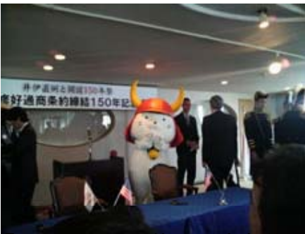
『7/29日米修好通商条約 締結150年記念式典』