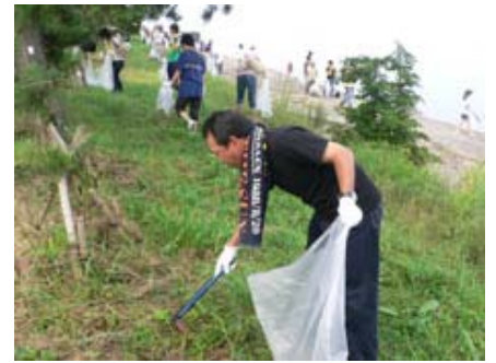
『9/7びわ湖クリーン キャンペーン』