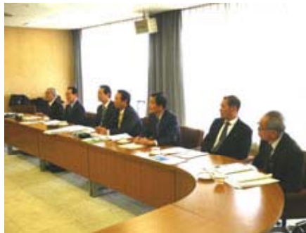
『2 / 1 2 議会運営委員会研修』