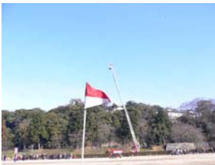
『1 / 8 彦根市消防出初式』