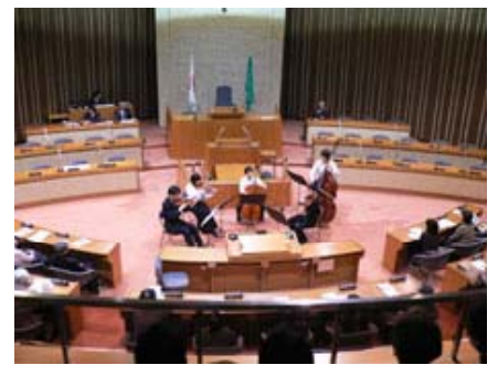
『2 / 1 4 議場コンサート』