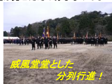
威風堂堂とした 分列行進!

しかし、災害時は自助・共助・公助の順となり、まだまだ未整備な地域の防災会を立ち上げる必要があると考えます。