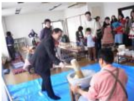
『1 / 29 居住者会餅つき』