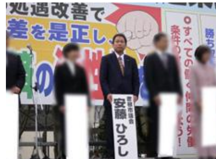
『3 / 5 (連) 春闘決起集会』