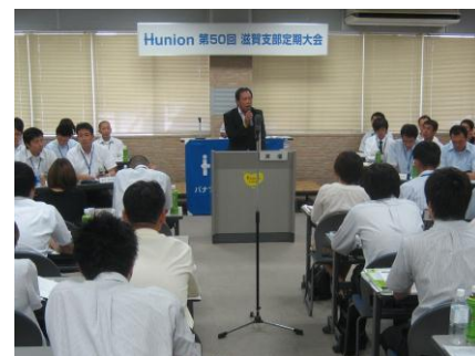
『8/6 電工労組定期大会』